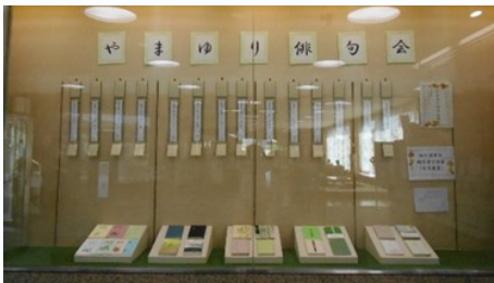
サークル展示 やまゆり俳句会