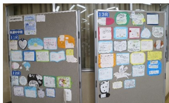
中高生イチオシ本のPOPを書こう！