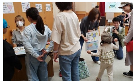
世界のじゃんけん