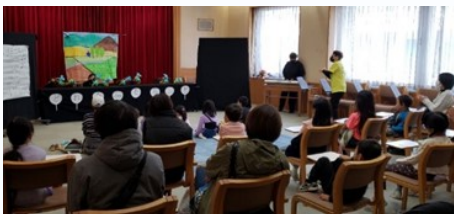
サークル発表 人形劇