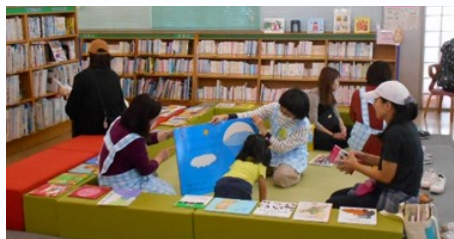
すきすき絵本タイム