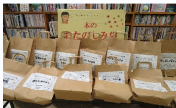
大人向け本のおたのしみ袋