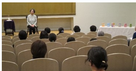
サークル発表 大人のためのお話し会