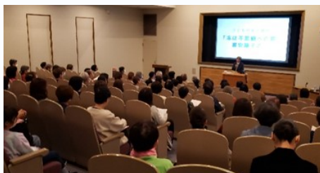
子どもの本の講座