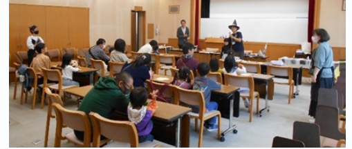
「ハロウィン工作教室」