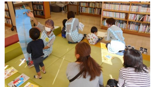
すきすき絵本タイム