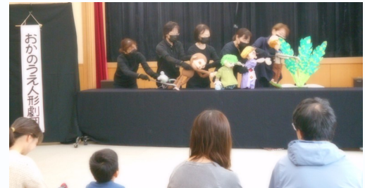
おかのうえ人形劇団「おおきなかぶ」