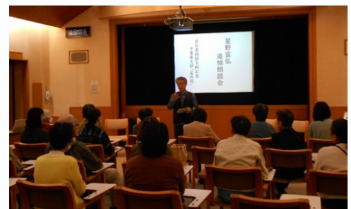
「星野富弘さんを偲んで ～鈴の鳴る道 朗読会～」