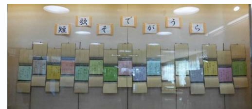
短歌そでがうら「詠草」