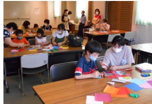
【長浦：おりがみでおてがみをつくろう】

手紙をテーマにした絵本「きょうはなんのひ」の読み聞かせのあと、おりがみてがみの「シャツ」と「こびと」を作成しました。子どもも保護者も目を輝かせて絵本を楽しみ、おりがみてがみの制作では、子ども達が一生懸命手紙を書いたり折ったりする姿が見られました。