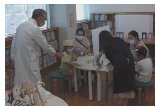
【平川：つくってあそぼう】

作ったバランスとんぼに思い思いの色を塗り、指に吸い付くように止まるようすを楽しんでいました。