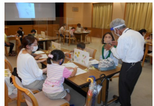
【中央：みんなでたのしいぬりえ教室】

工作ボランティアが講師となり、さらに上手に塗るためのコツや子どもとのお家でのぬりえの楽しみ方などアドバイスをしていました。親子でぬり絵を楽しむ様子が見うけられました。